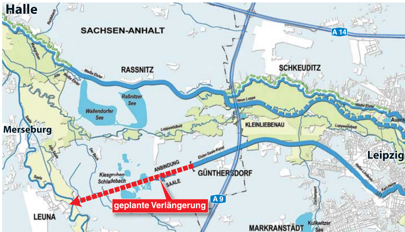
Das noch fehlende Teilstück liegt auf sachsen-anhaltischem Gebiet.